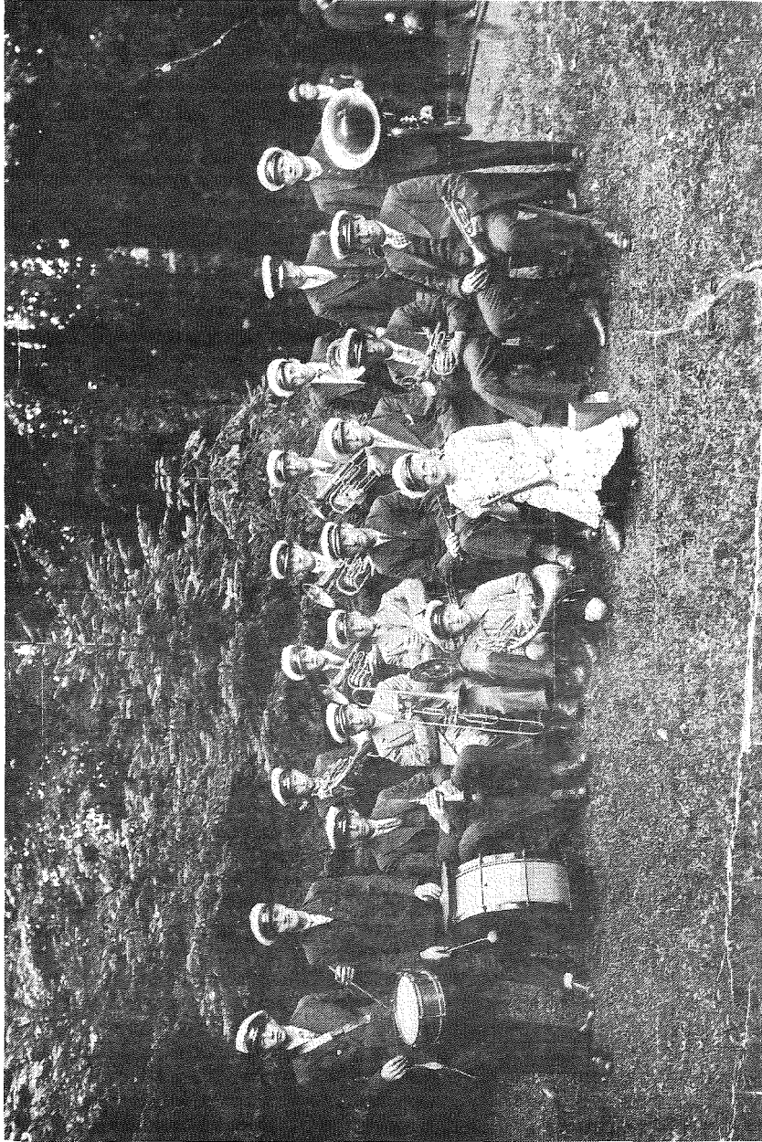
Muziekkoncoursfoto omstreeks 1930-1932 te Leeu, van het corps "Orpheus" te Opende.